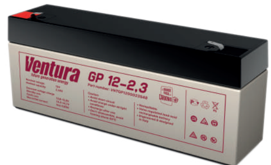
Габаритные размеры, мм