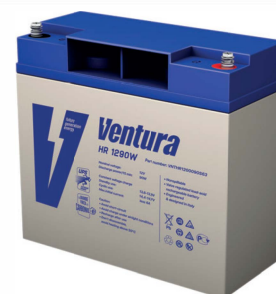
Габаритные размеры, мм