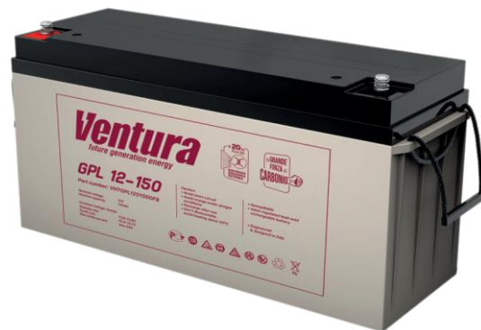
Габаритные размеры, мм